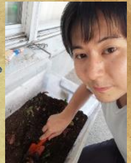
会派室の生ごみ堆肥