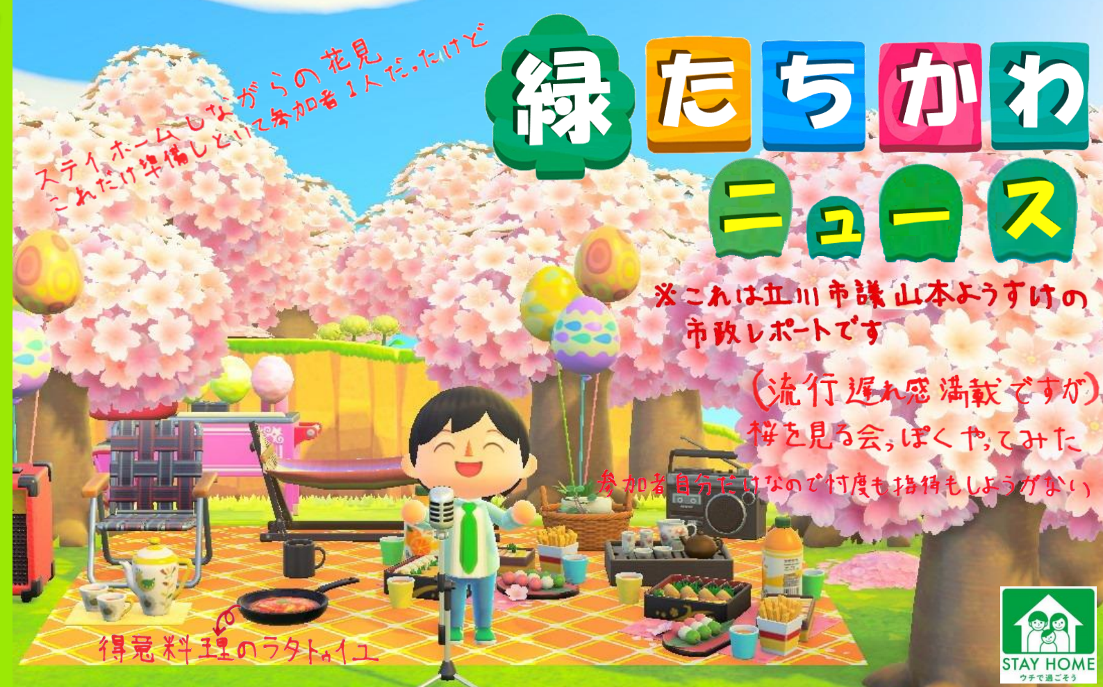
※本画像は「ネットワークサービスにおける任天堂の著作物の利用に関するガイドライン」に準拠して投稿した画像を使用しています