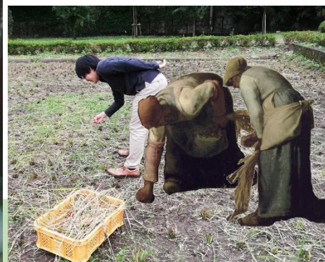
立川市に残る唯一の田んぼで稲刈り 芸術の秋だからミレーの「落ち穂拾い」っぽくしてみた